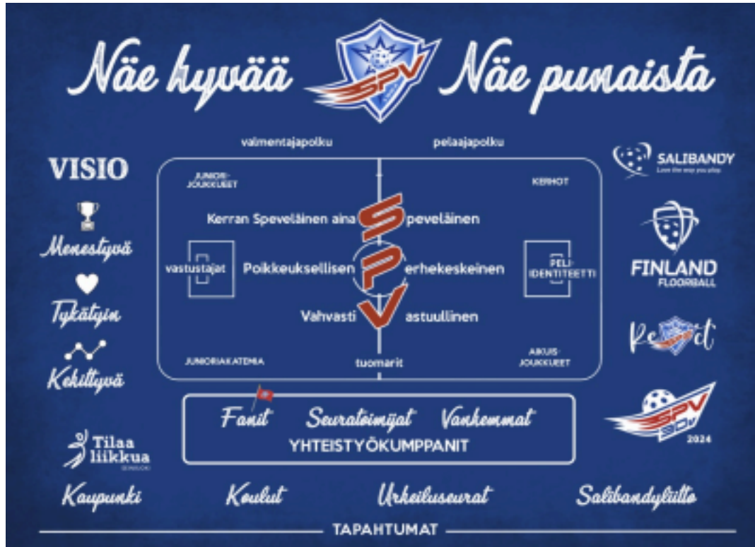
Kuva 1. Seuran strategia

Teet arvokasta työtä seuramme ruohjuuritasolla!